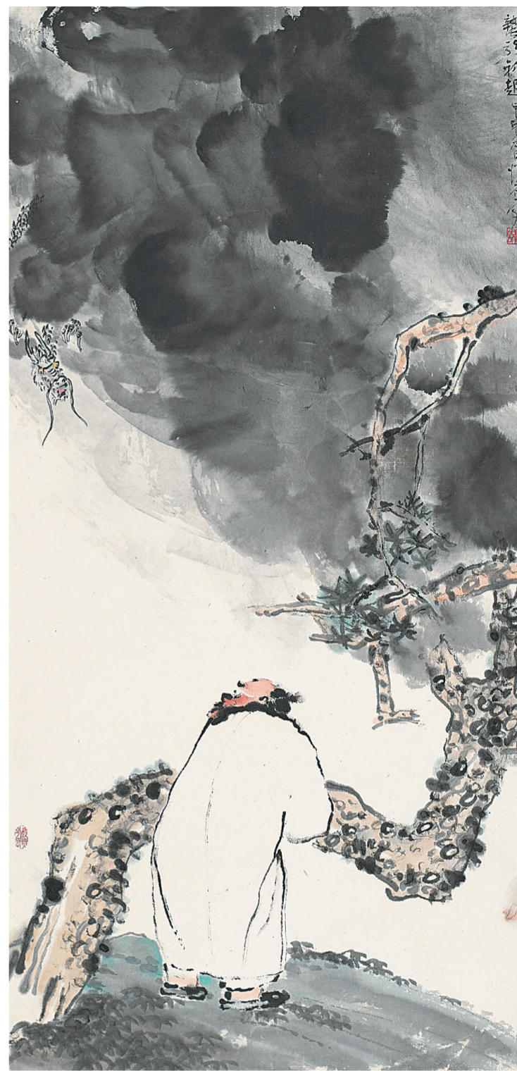
▲吴悦石《蛟龙初起》 85cm×41cm 纸本设色 2004年

悦石先生尚值盛年，无有数十年用功不辍，何臻今日圆融之境？余深为其取得的成就而感佩，更以为，以其目今之学养造化、精神体魄，能与现代生活切近结合，彰显时代精神风貌，只须假以时日，定能辟出另一番光明境界，余偕众同好共期待之。