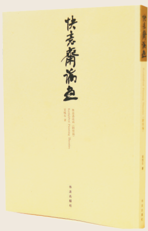
▲《快意斋论画(附续编)》

5月2日下午3时，备受瞩目的“吴悦石《快意斋论画(附续编)》新书发布会暨论画讲座”如期在清秘阁举行。本次活动由中国书画出版传媒、书画出版社、清秘阁主办的“吴悦石《快意斋论画(附续编)》新书发布会”及由中国书画杂志社、清秘书院、北京市锡纯艺术教育公益基金会主办的“吴悦石论画讲座”，两个环节组成。