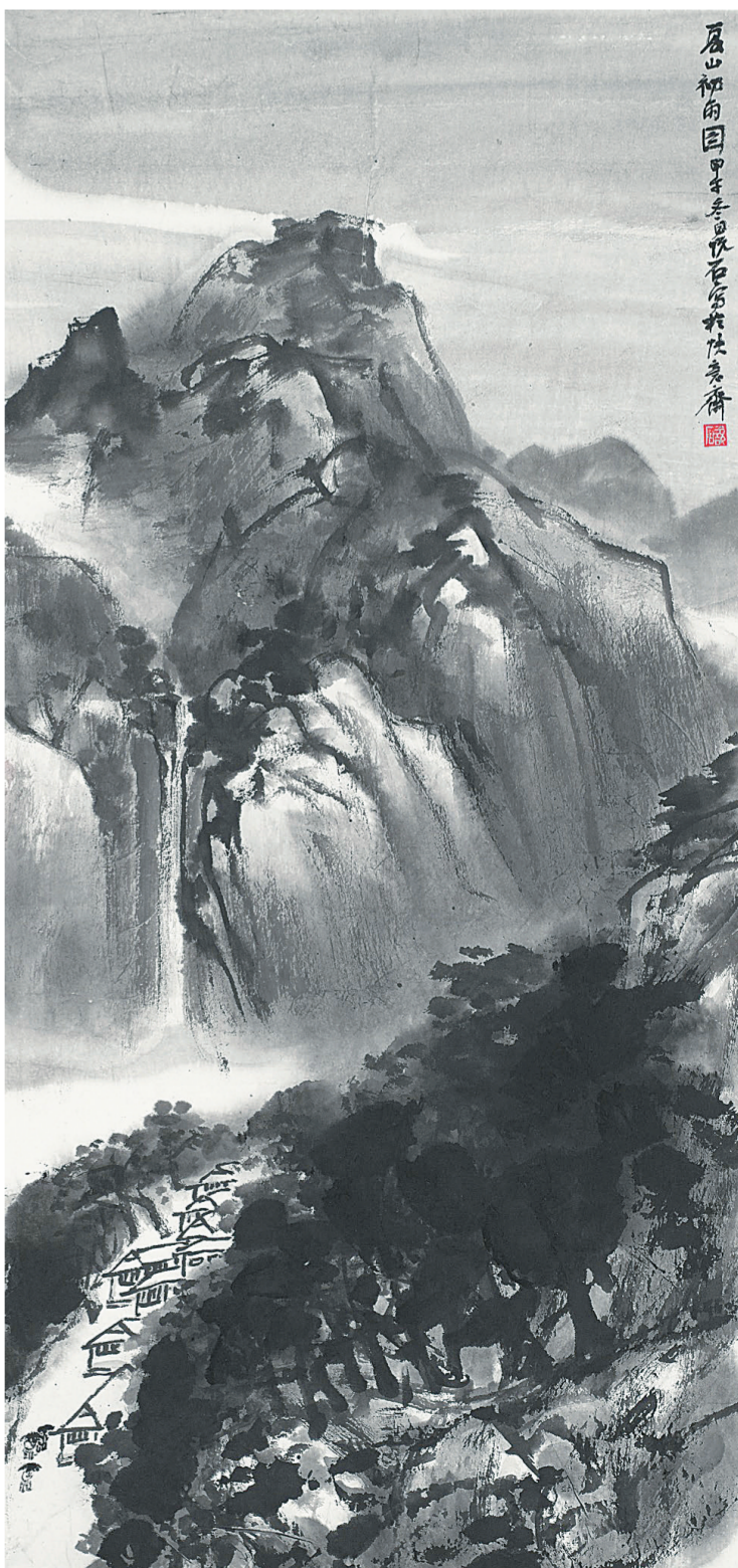
▲吴悦石《夏山初雨图》 102cm×48cm 纸本墨笔 2014年