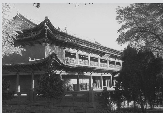
张掖风光·大佛寺

漫步在张掖的街头,不经意间你就会碰上一处古迹:隋代木塔、西夏国寺、明代钟鼓楼、山西会馆、总兵府、民勤会馆、南华书院,抑或是一座明清时期的民居……在这样一个有历史、有故事的小城生活,每一天你都能感知这座城市的厚度。