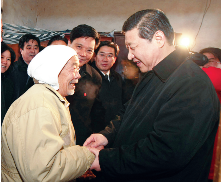
资料图:2008年1月11日至14日,时任中共中央政治局常委、中央书记处书记的习近平到河北省西柏坡村,同乡亲们一起学习、参观、交流。这是1月12日,习近平来到平山县西柏坡村困难群众家中看望。

新华网石家庄7月13日电(记者李斌) (2013年7月11日至12日,党的群众路线教育实践活动开始不久,中共中央总书记、国家主席、中央军委主席习近平来到自己联系的河北省调研指导。 “当年党中央离开西柏坡时,毛泽东同志说:‘进京赶考’。60多年过去了,我们取得了巨大进步,中国人民站起来了,富起来了,但我们面临的挑战和问题依然严峻复杂,应该说,党面临的‘赶考’远未结束。”