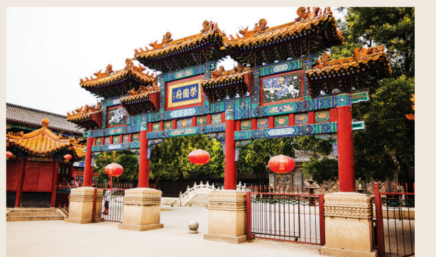
1987版《红楼梦》“荣国府”外景基地

1987版《红楼梦》“荣国府”外景基地 正定县无偿提供场地,中央电视台投资建设。1986年8月,“荣国府”景区顺利竣工。1987年,随着电视剧《红楼梦》的播出,正定知名度大提高,当年有130万人次前来参观游览,门票收入就达221万元,旅游收入1761万元,很快就收回了投资。“荣国府”景区极大地带动了正定旅游业的发展,开创了旅游业“正定模式”。